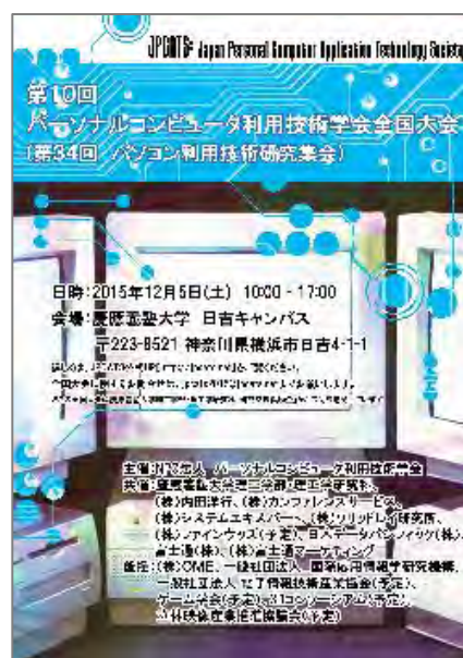
-第 10 回全国大会ポスター-