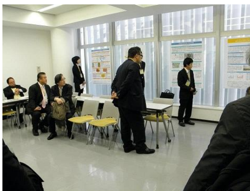
第 7 回全国大会 ポスターセッション会場