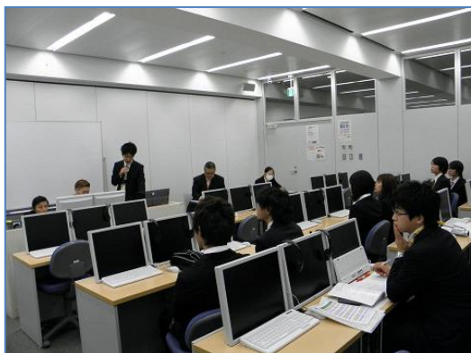
第 7 回全国大会 講演会場